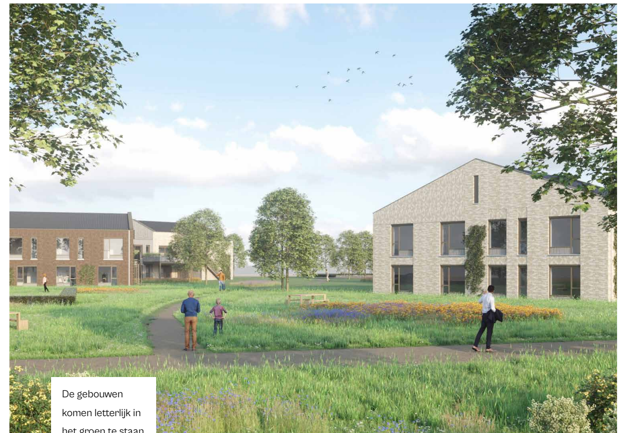
De gebouwen komen letterlijk in het groen te staan.

Naast nieuwe (zorg)gebouwen komen er ook andere functies bij. Zo is er een nieuwe kas bij de boerderij, zijn er bankjes langs de lanen geplaatst en is het eerste kunstwerk van de kunstroute geplaatst. Ook zijn de eerste nieuwe gebouwen van buitenplaats wonen in aanbouw. Zo wordt het landgoed steeds levendiger!